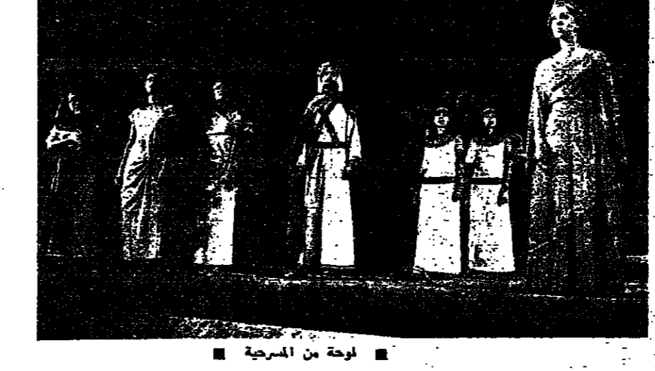
لوحة من المسرحية